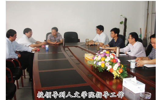
校领导到人文学院指导工作