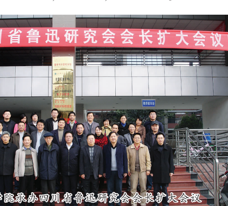
学院领导与金太阳幼儿教育集团签署合作协议

学院强化教学运行与质量监控。院、系领导经常抽查课堂教学，辅导员不定期巡视课堂，干部和全体教师坚持互相听课、评课；学院教学督导组对教学活动进行监督；学院定期召开座谈会，收集学生意见；学生干部填写教学周报汇报课堂情况，教学办按期编发教学简报向全院教师通报教学情况，形成教学常规化、常态化、制度化。 人才培养仅仅靠教学改革是不够的，